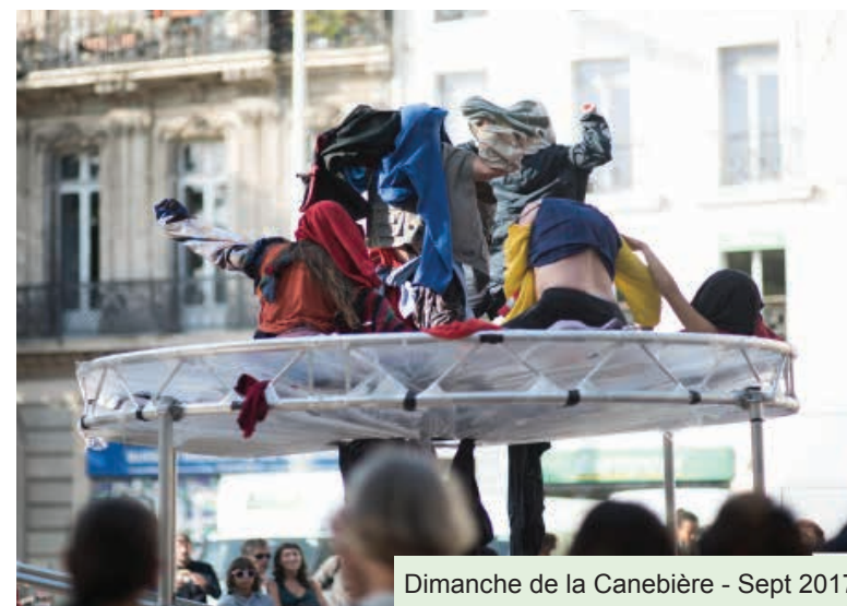
Dimanche de la Canebière - Sept 2017