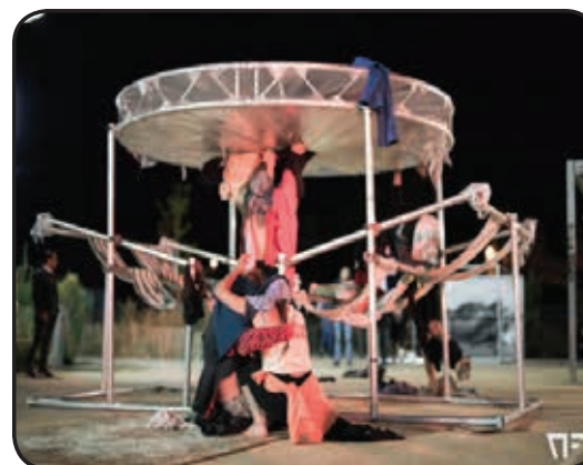
Partie 3 Recycler les fringues