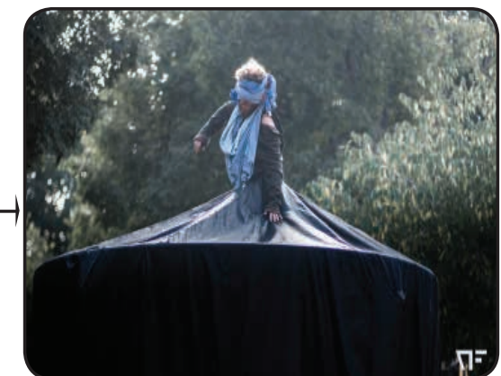
Partie 4 Redistribuer les fringues