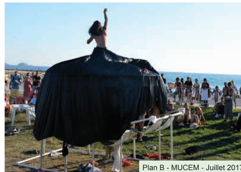
Plan B - MUCEM - Juillet 2017

Nos vieux vêtements ou ceux récupérés sur les rivages de la Méditerranée se métamorphosent avant de s'échanger dans une "danse du recyclage" poétique et colorée.