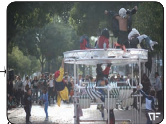
Partie 2 Revêtir les fringues