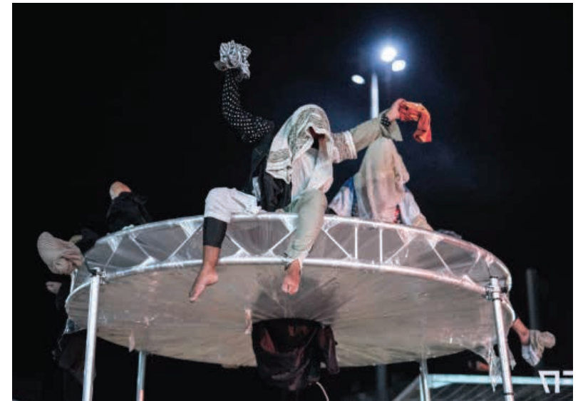
Friche la Belle de Mai - Sept 2017