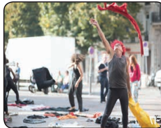
Partie 1 Trier les fringues